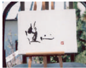
キャンバス夢文字