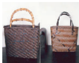
紙バンドの編カゴ