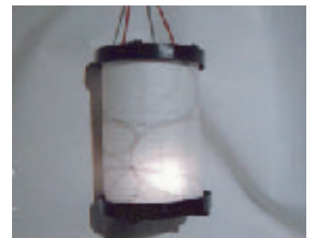
コミュニティーアート・小田原ちようちん