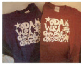
小田原グラフィックスTシャツ