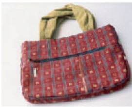
世界にひとつだけ「わたしのバッグ」