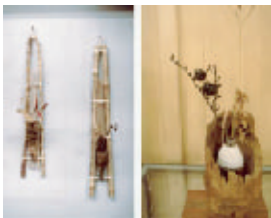
流木オブジェ・木の菓子皿・炭