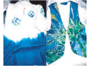
藍染、ローケツ染衣服