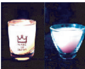
オリジナル・グラスキャンドル