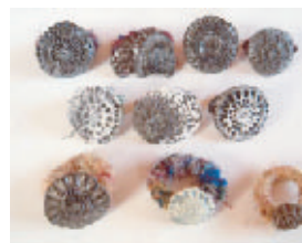
陶器でアクセサリ