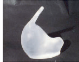
ポリ樹脂・動物オブジェ