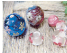
トンボ玉の製作実演、販売