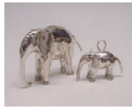
アニマル・ジュエリー